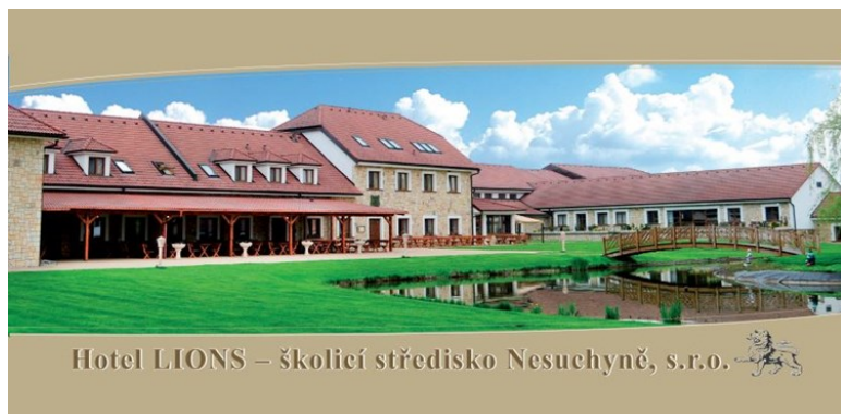
Hotel LIONS—školící středisko Nesuchyně, které nám poskytlo prostory pro uspořádání vzdělávacího cyklu pro ředitele škol

Účast na všech akcích byla hojná a akce byly hodnoceny jako velmi zdařilé. Převažná většina akcí byla realizována na základě potřeb, které vyplynuli při sestavování dokumentu Místní akční plán. Tyto potřeby si nadefinovali sami aktéři ve vzdělávání na území.