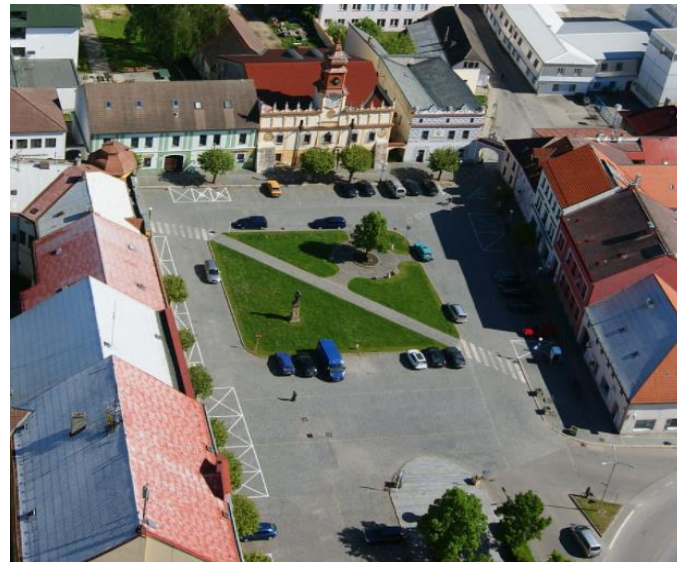
Veselí nad Lužnicí