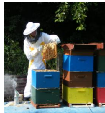
Jeden ze členů ZO ČSV Litoměřice při práci

Také se mne často lidé ptají, jak poznat falešný nebo upravovaný med? Poznat to jde velmi obtížně. Primárním příznakem poškození medu bývá například to, že nekrytalizuje (tj. necukernatí). Krytalizace totiž patří mezi základní vlastnosti medu, včetně medu akátového. Zatímco ale čistý akátový med zkrystalizuje až po mnoha letech, tak takový řepkový med krystalizuje často už po několika dnech od vytáčení z plástů. Tekutý med jde ale mnohem lépe na odbyt, proto se používají různé metody, jak krystaliza-