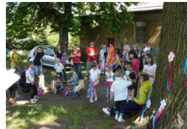
Slavnosti stromů Prackovice n/L 2011

kojení všech uchazečů bude z původně stanoveného finančního limitu žadatelům z řad obcí a svazků obcí přiděleno po 6.500,-Kč, neziskovým organizacím po 10.000,-Kč, jeden projekt, jehož se zúčastnily základní školy z celého regionu, byl podpořen částkou 8.000,-Kč.