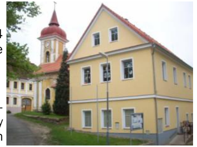
Kaple a obecní úřad

První zmínka o obci Svařenice je z roku 1253, kdy byla králem Přemyslem Otakarem II. obec rozdělena na dva díly. Původní název obce měl vyjadřovat, že se jedná o ves Svařimírových lidí. Název obce se mnohokrát měnil, až na současnou podobu - Svařenice. Na návsi se nachází kaple sv. Václava a sv. Martina. Kaple pochází z roku 1762. V obci se lidé živilí zemědělstvím. V současné době žije v obci 109 obyvatel.