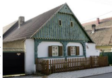
Roubenka v Chodounech

V roce 2012 probíhá rekonstrukce sálu v Chodounech a rekonstrukce galerie vesnických tradic.