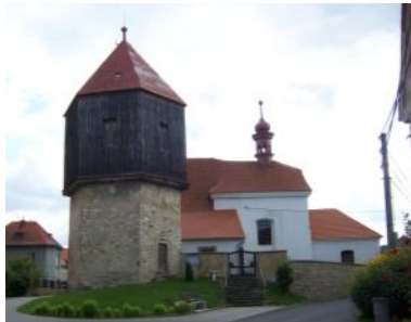
Kostel sv. Mikuláše před rekonstrukcí zvonice