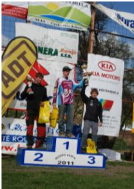
Motokros Kamýk 2011

MAS v roce 2011 vyčlenila z vlastních zdrojů 110.000,- Kč pro neziskový a veřejný sektor na podporu realizace kulturních, sportovních, vzdělávacích, společenských a podobných akcí.