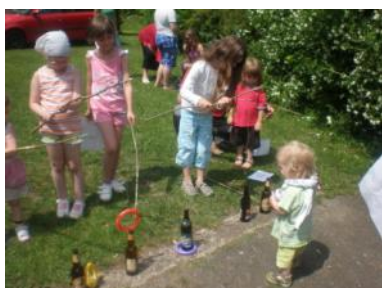
Dětský den v Chotiněvsi